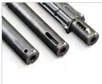
Different front attachment available Disponibili diversi attacchi anteriori

Design accattivante e innovativo Dimensioni compatte Finecorsa integrati e regolabili